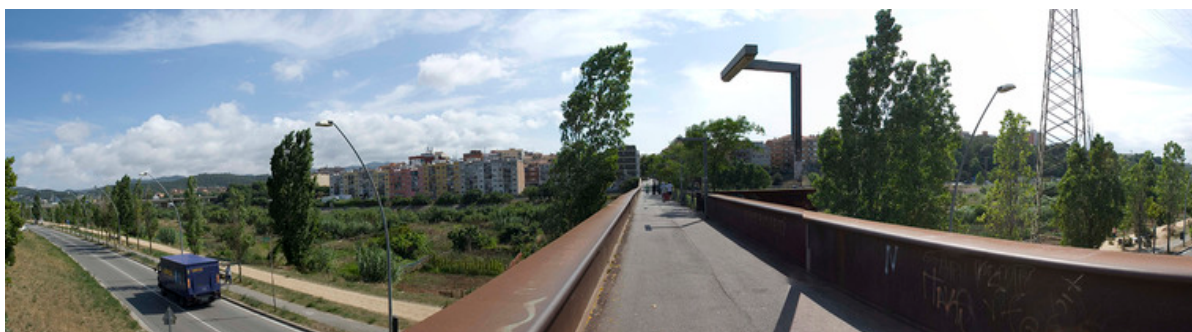
Pont sobre el riu Ripoll entre Ripollet i Cerdanyola.