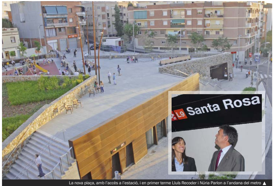
La nova plaça, amb l'accés a l'estació, i en primer terme Lluís Recoder i Núria Parlon a l'andana del metro ▲

Amb les sis estacions de la L9 en marxa a Santa Coloma, des d'aquesta ciutat es pot accedir al centre de Barcelona en qüestió de minuts, a través de l'intercan-